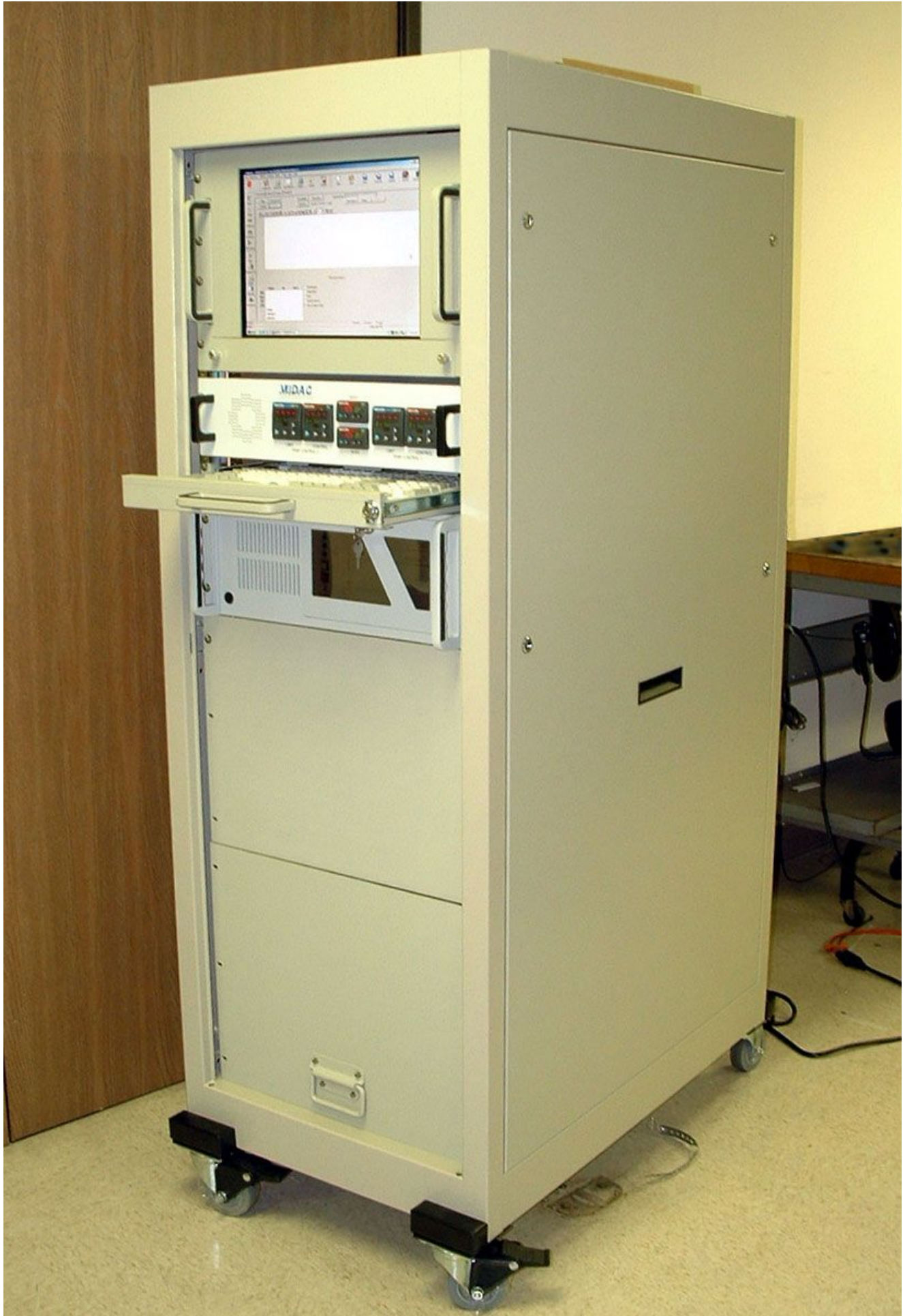
TITAN ONLINE ANALYZER with 20M CELL